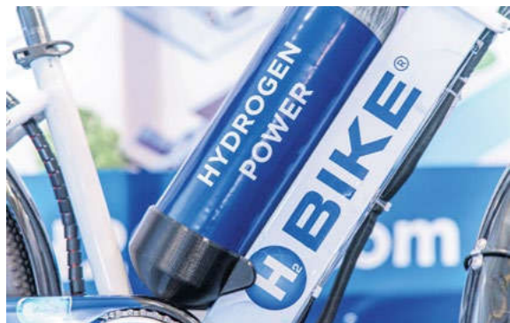
Vodíková láhev na 150 km dojezdu

Představené kolo je pouze prototypem, ale už nyní plně odpovídá požadavkům Green Deal, je totiž bezemisní a nezanedbává uhlíkovou stopu. Společnost nyní stojí před otázkou, jak dostat kola do provozu, aby byla snadná na údržbu a jejich provoz nebyl finančně náročný. „Budeme muset vyřešit plnění lahví, tak aby uživatel nemusel jezdit na čerpací stanici a vodík do kola tankovat. Chceme vytvořit systém, kdy každý bude mít možnost si jednoduše vyměnit prázdnou lahev za plnou, jako je tomu dnes s propan-butanem nebo dříve s bombičkami k sifonu. Cílem je dosáhnout nejnižší možné ceny pro koncového spotřebitele, ideálně v řádech stovek korun za jednu lahev,“ uzavírá David Maršálek.