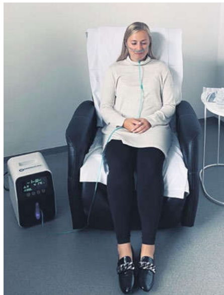
Blahodárná inhalace molekulárního vodíku v Lázních nad Bečvou

Mnoho našich klientů se s molekulárním vodíkem setkává poprvé přímo u nás v lázních, ať na základě doporučení lékaře, nebo jsou to sami klienti, kteří si mezi sebou sdělují dojmy z procedur. V poslední době se setkávám s postupným zaváděním vodíku i v jiných lázních, vím, že jej využívají v Jánských Lázních či Slatinicích.