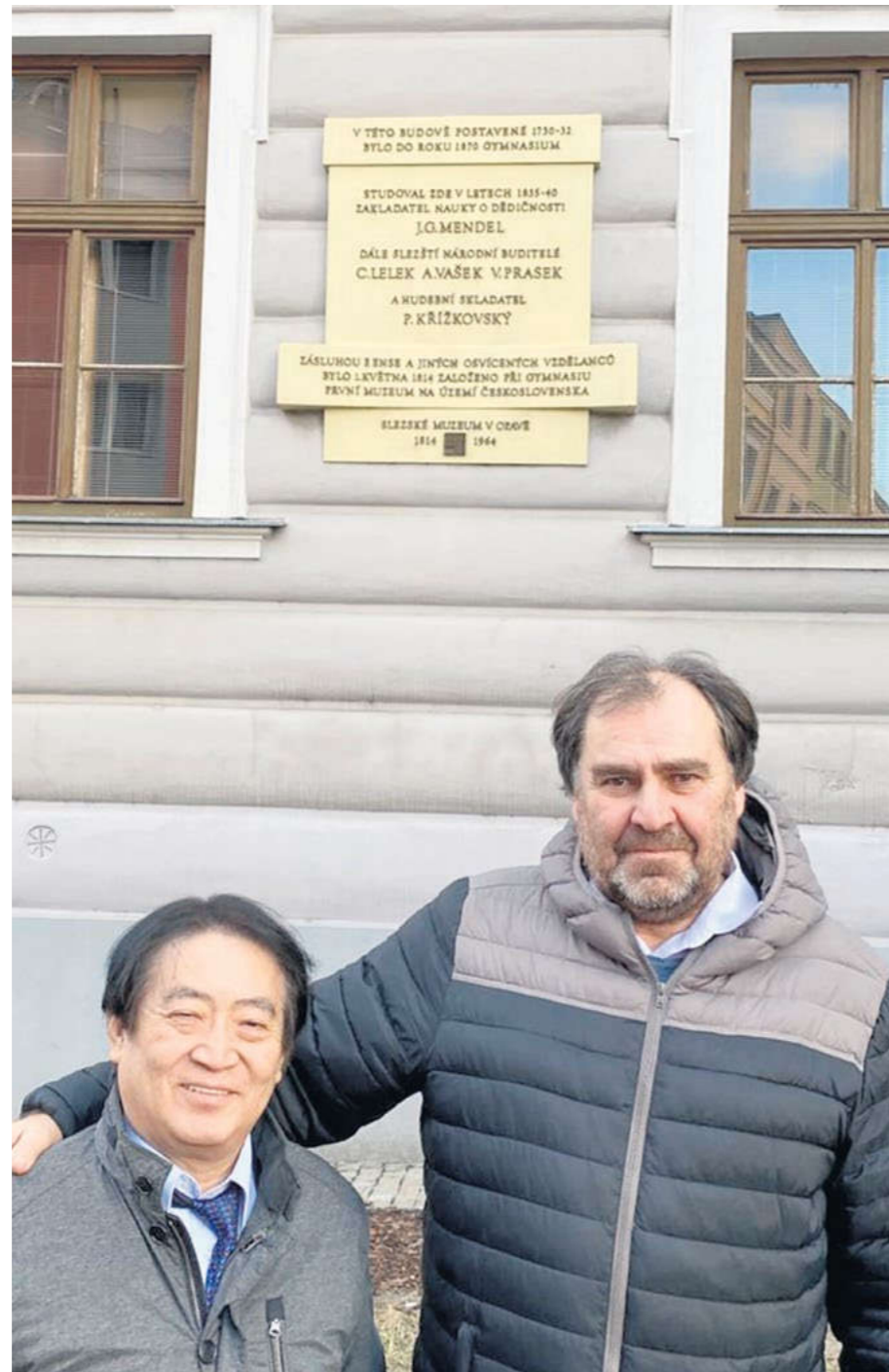
Před budovou Slezského muzea v Opavě