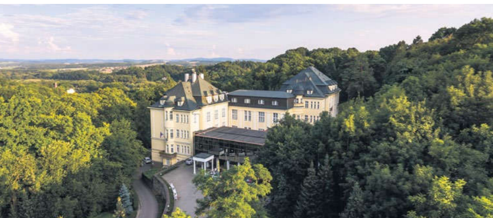
Teplice nad Bečvou jsou známé i svým klidem, nenapodobitelným půvabem, zázračnou teplou kyselkou, okolními lesy a jeskyněmi

www.H2world.cz | email: info@H2world.world | tel: 777 724 731