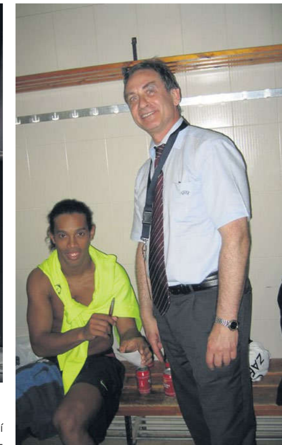
S brazilským fotbalovým reprezentantem Ronaldinhem, vítězem Mistrovství světa, vítězem Ligy mistrů UEFA a dalších nejceněnějších fotbalových pohárů včetně vítězství v anketě Zlatý míč, který je určen nejlepšímu fotbalistovi planety

ný, je s ním plně kompatibilní. Jako nejučinnější antioxidant ji dokáže velmi dobře a velmi rychle vyčistit. Molekulární vodík je v dnešní uspěchané, zátěžové době, kdy většina z nás nedokáže nebo ani nemůže zpomalit své životní tempo, ideálním produktem aktivní prevence. Víte, nejde jen o to, že molekulární vodík do-