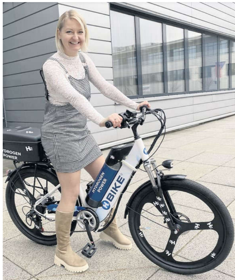
Novináři si mohli H2 Bike vyzkoušet