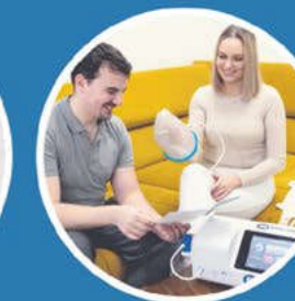
návrkové aplikátory na končetiny