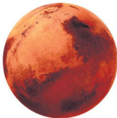
„Výroba a recyklace vodíku ve vesmíru sníží náklady a složitost vzdálených misí snížením spotřeby zásob dodávaných ze Země,“ uvádí doslova NASA.

Vodík bude na Marsu používán jako palivo pro dopravu, jako zdroj elektrické energie a pro další účely. Marsovská „továrna na vodík“ by dokonce mohla sloužit jako zdroj paliva pro další vesmírné cesty člověka Sluneční soustavou.