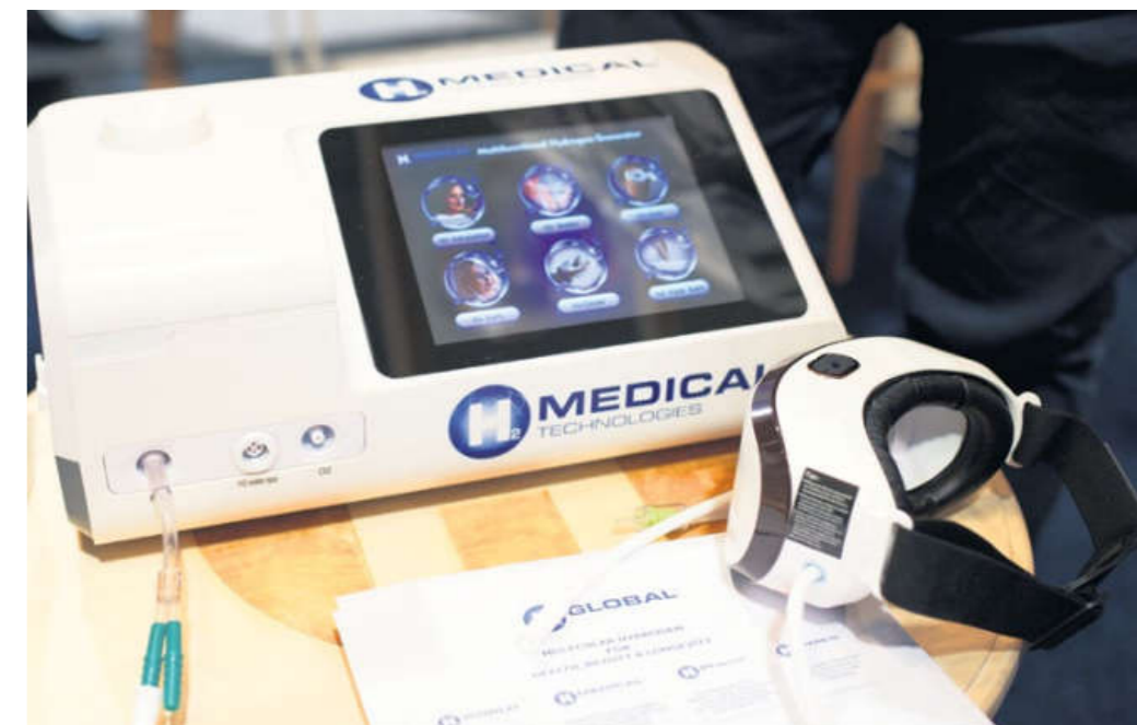
Multifunkční zařízení se 6 možnostmi aplikace vodíku

► VODÍKOVÁ LÁHEV 3 v 1, tedy se třemi možnostmi využití: