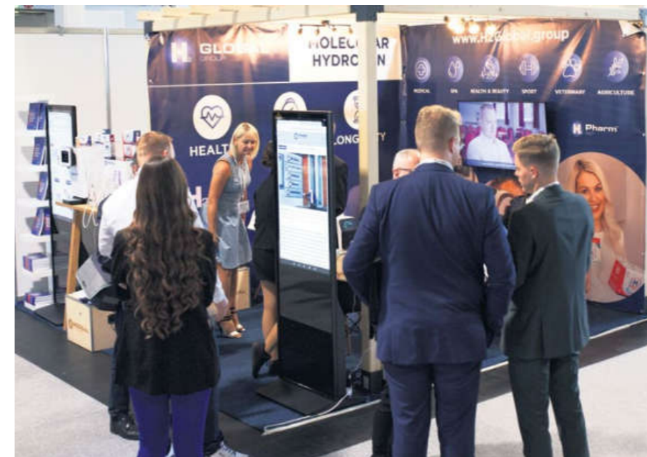
Stánek společnosti H 2 Global Group na EXPO